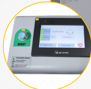
Pony touch logic

Struttura robusta e compatta Solid and compact framework