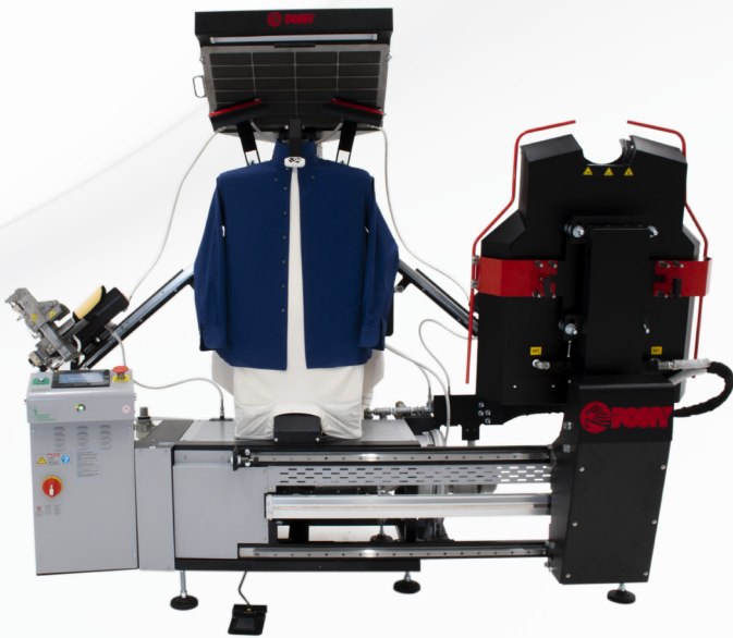
ANGEL 3.0 CAMICIE / SHIRTS